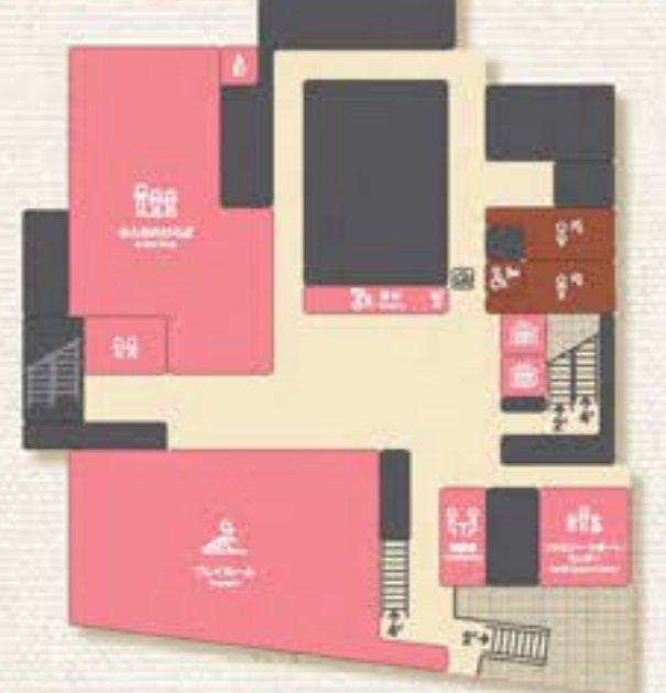
相互援助活動のしくみ