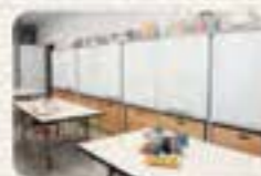
体験学習コーナー

子育てや科学に関する講演会、チャレンジ教室などのイベントを開催します。部屋が広い場合は、一般への貸出も行います。