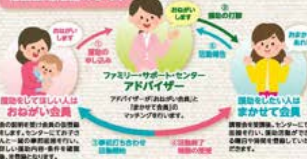
ファミリーサポートセンター

地域の中で、「子育ての援助をしてほしい人」(おねがい会員)と「子育ての援助をしたい人」(まかせて会員)が会員となり、一時的な子育てを助け合うボランティア組織です。子どもを持つすべての家庭が、地域の中で安心して子育てができるように、会員のみならず、相互援助活動をサポートします。会員登録料・年会費・保険料は無料。お問合せ 受付時間9:00~17:00 TEL:0871-633-2226